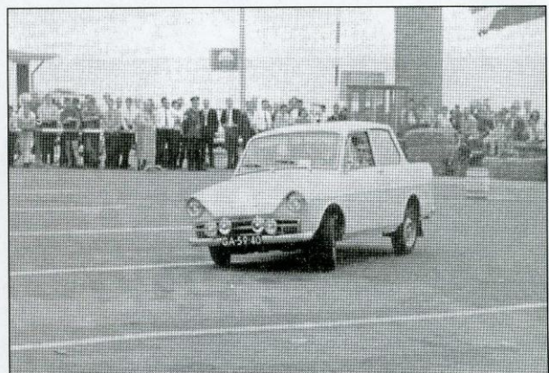
Pieter van Vollenhoven in actie bij de SLS 1962.