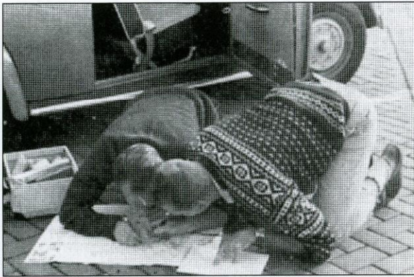
Intekenen van de kaart voor de start.

Via de Velsertunnel moesten de deelnemers met een grensrit, uitgezet op de ANWB-kaart, door Noord-Holland. Dit traject werd in Den Oever aan de borders van de Zuiderzee en de Waddenzee afgesloten. Een regelmatigsetappe over de Afsluitdijk bracht de karavaan van 250 deelnemers naar Friesland. Inmiddels was de mist sterk toegenomen en tevens begon de duisternis in te vallen. Daar er maar liefst twee routebeschrijvingstrajecten moesten worden gereden naar Nijverdal vielen de strafpunten bij honderden. Bij beter weer waren deze trajecten stellig ook al een zware kluit voor de deelnemers geweest. Maar de route-uitzetter hadden er op een uiterst knappe manier voor gezorgd dat goed- en foutrijders elkaar telkens weer vonden, zodat grote afdwalingen van de route praktisch uitgesloten waren. Echter met de toenemende mist - met af en toe niet meer dan 25 meter zicht - werd het voor de deelnemers een hele zware klus om, ondanks dat men 60 minuten tijdoverschrijding mocht hebben, de VTC te halen. Degenen die nog op tijd arriveerden hadden nagenoeg geen rust meer over en moesten direct weer verder. Het vierde traject was stafkaartbladen met een uitstekende ingetekende route, een mooi traject met vele bos- en zandpaden. Gelukkig was voor de bestuurder het zicht in de bossen veel beter dan daarbuiten en bereikte men zonder